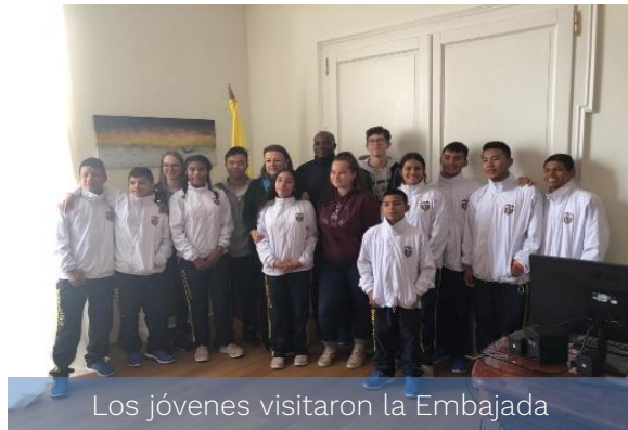
Los jóvenes visitaron la Embajada