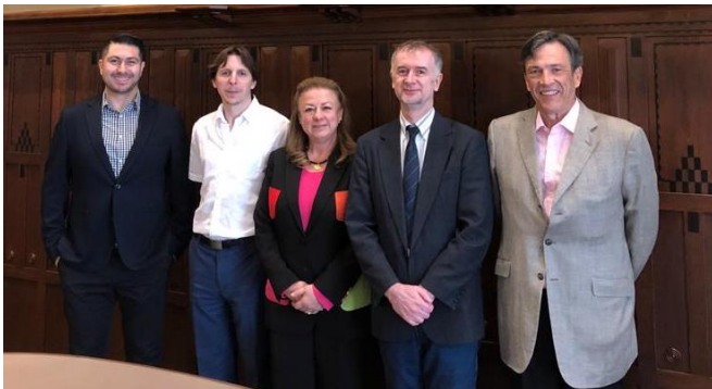
Visita a la famosa academia de música de Hungría, Ferenc Liszt