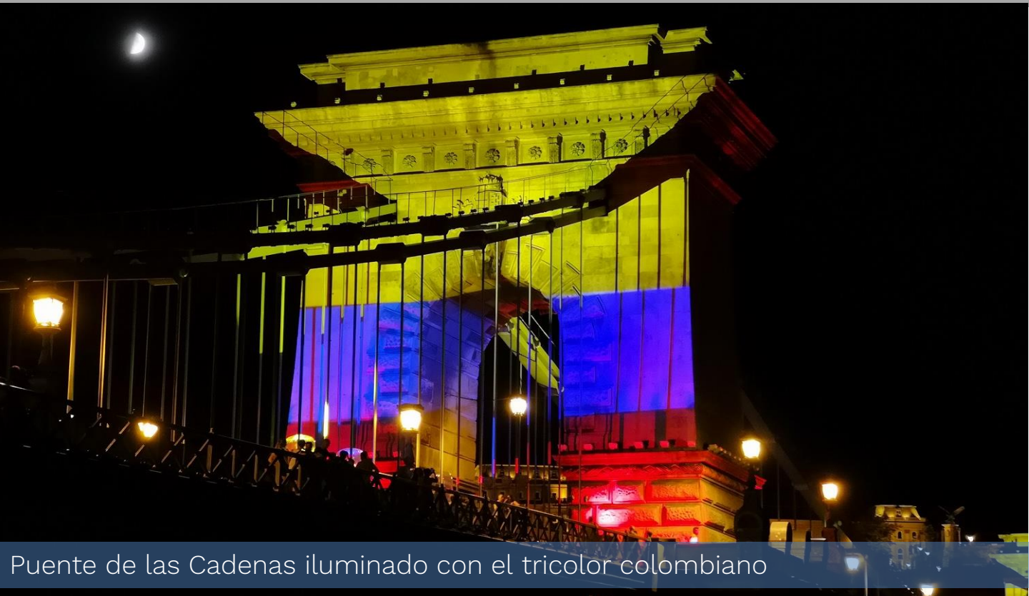
Puente de las Cadenas iluminado con el tricolor colombiano