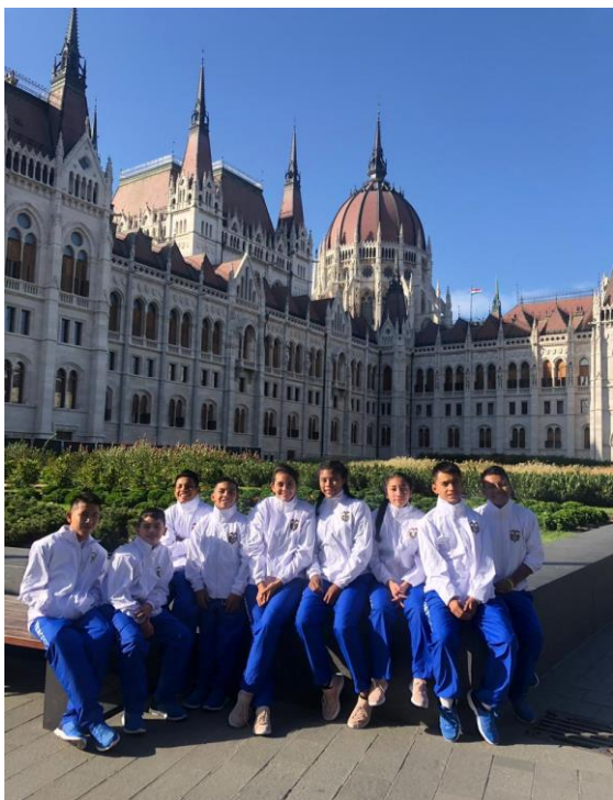
Visita al Parlamento húngaro