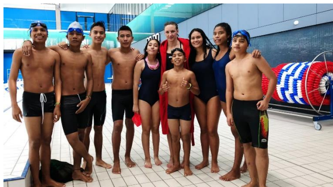
Encuentro con la medallista olímpica húngara, Katinka Hosszú