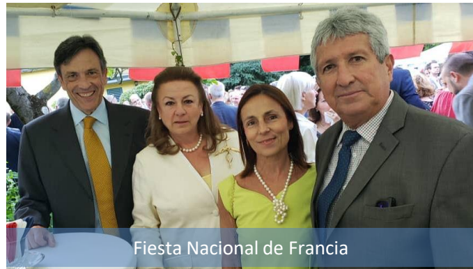
Fiesta Nacional de Francia