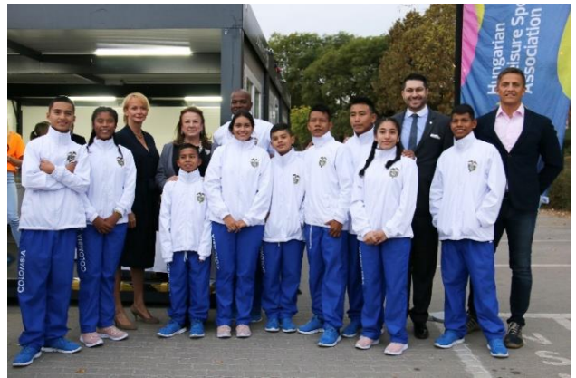
Jóvenes en la “Be Active Night”