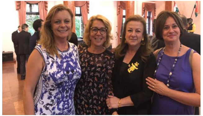
Embajadora de Colombia con representantes ciudadanas del sector educativo y comercial de Hungría