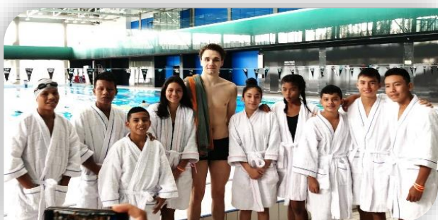
Encuentro con el medallista olímpico Kristof Milak

Del 26 de septiembre al 6 de octubre, 9 jóvenes y el entrenador de la Casa Lúdica del Amazonas participaron en distintas actividades deportivas, académicas, lúdicas y culturales.