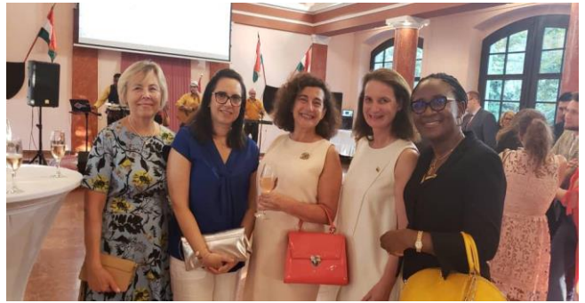
Embajadoras de Lituania, Marruecos, Chile, Austria y Nigeria