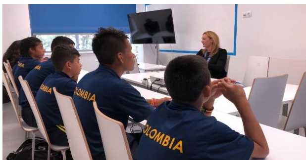
Encuentro académico con la medallista olímpica Ágnes Kovács en la Universidad de Educación Física de Budapest

Adicionalmente, tuvieron una sesión diaria de entrenamiento en el complejo deportivo "Duna Aréna", sede del Campeonato Mundial de Deportes Acuáticos en el 2017, 2018 y 2021.