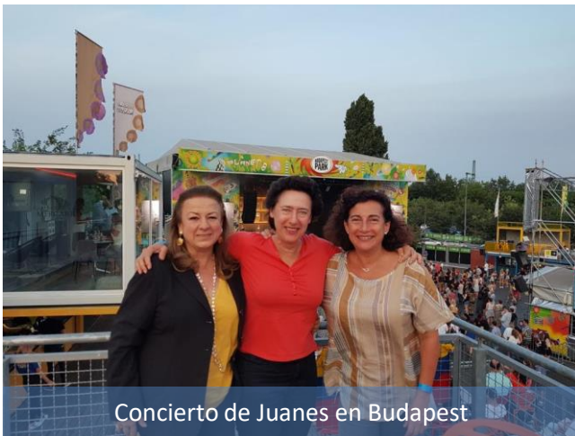
Concierto de Juanes en Budapest