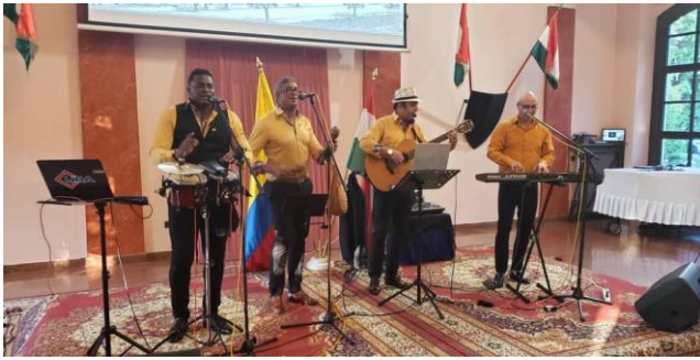
Grupo musical 'La Movida'