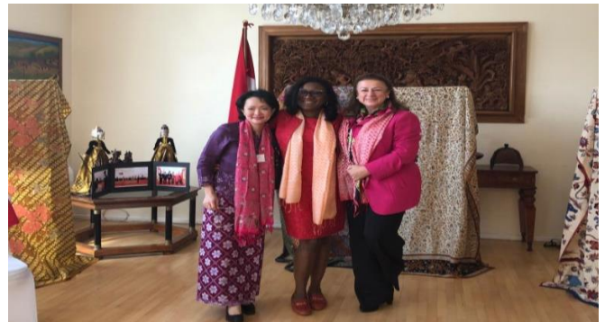
Promoción de Batiks indonesios