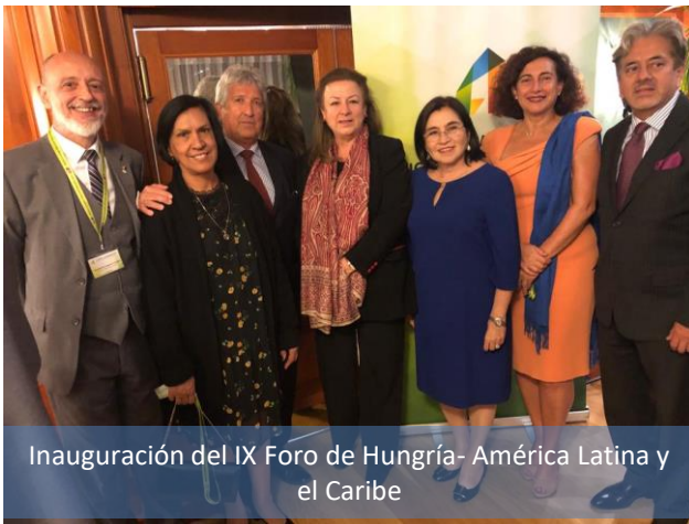
Inauguración del IX Foro de Hungría- América Latina y el Caribe