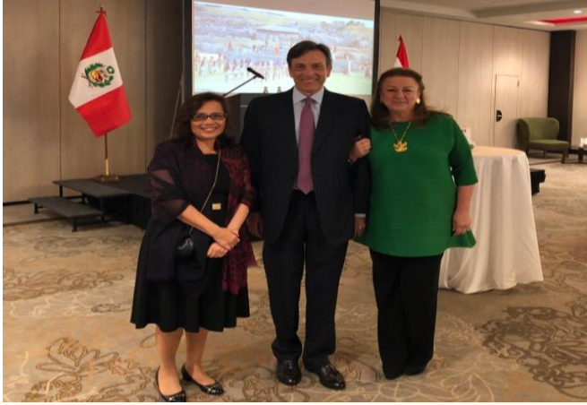
Fiesta Nacional del Perú