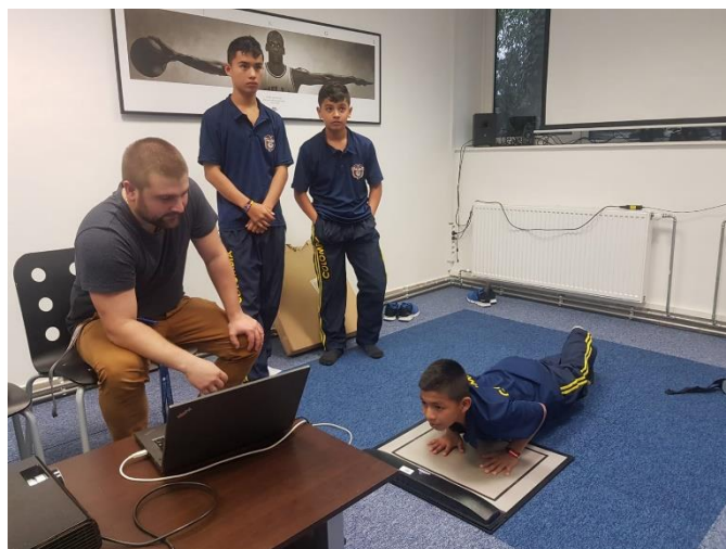
Sesión de "Sports Analytics" en la Universidad de Educación física de Budapest