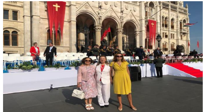
Fiesta Nacional de Hungría