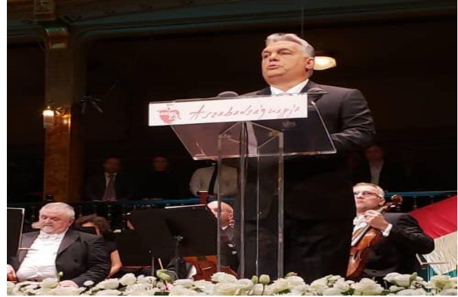
Discurso del Primer Ministro, Viktor Orbán, en el cual resalta que Hungría debería ser libre e independiente dentro del contexto de las Naciones Europeas