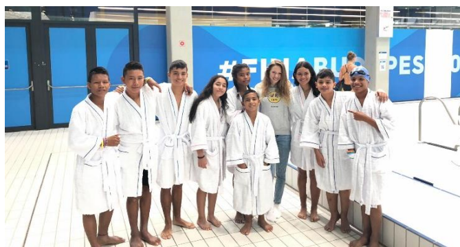
Encuentro con la húngara, Boglárka Kápas, campeona mundial de natación