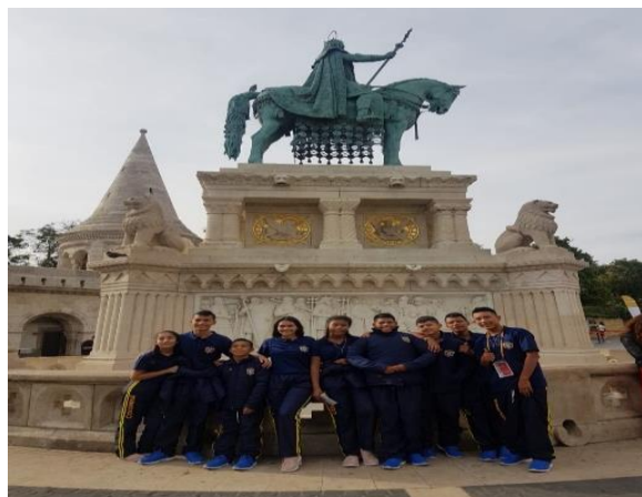
Recorrido por el centro histórico de Budapest, y visita al famoso monumento del Bastión de los Pescadores