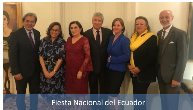
Fiesta Nacional del Ecuador

EMBAJADA DE COLOMBIA EN HUNGRÍA Tel: (+36) 1 - 6177041 Újpesti rakpart 1.II/6. 1137, Budapest. ehungria@cancilleria.gov.co