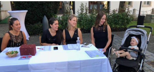
Celebración del Día Nacional