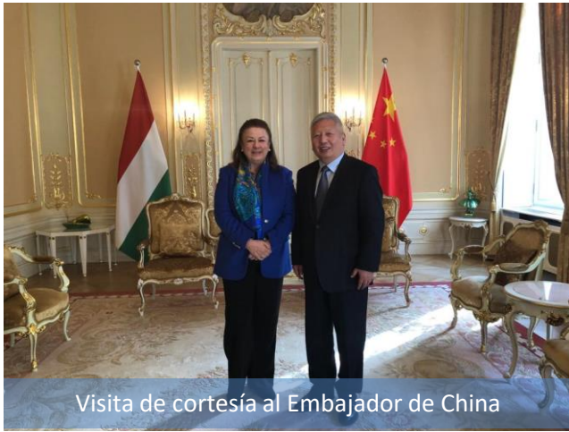
Visita de cortesía al Embajador de China