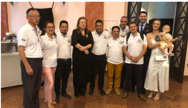
Representantes de Corpoamazonía