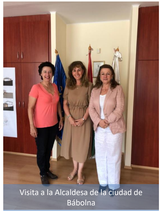
Visita a la Alcaldesa de la ciudad de Bábolna