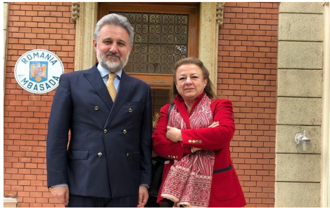
Visita de cortesía al Embajador de Rumania