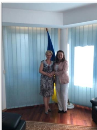
Visita de cortesía a la Embajadora de Ucrania, Luibov Nepop.