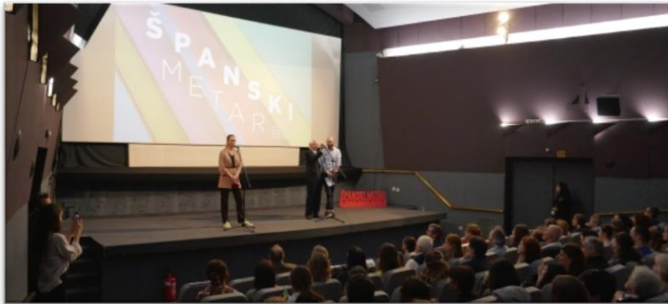
Entre el 15 y el 28 de mayo, Colombia presentó las películas 'Mamá' y 'La defensa del dragón' en el Festival Hispanometraje de Belgrado 2019.