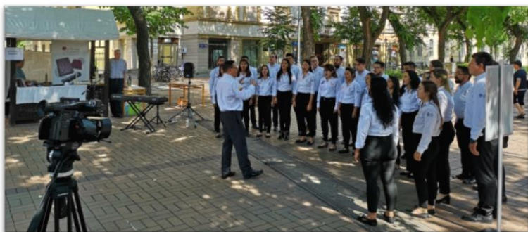
Concierto del coro de la Universidad Autónoma de Bucaramanga en la ciudad de Békéscsaba.