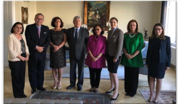
Reunión de embajadores del Grupo de Lima y Brasil en la Residencia del Perú, con el representante del Presidente interino de Venezuela, Juan Guaidó.