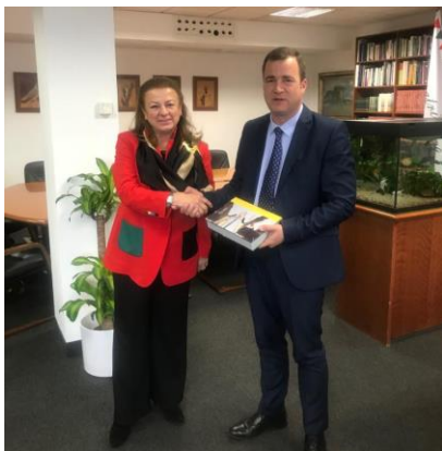
Encuentro con el Ministro de Medioambiente, Andrés Rác.