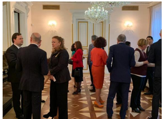
Recepción en la residencia de Colombia