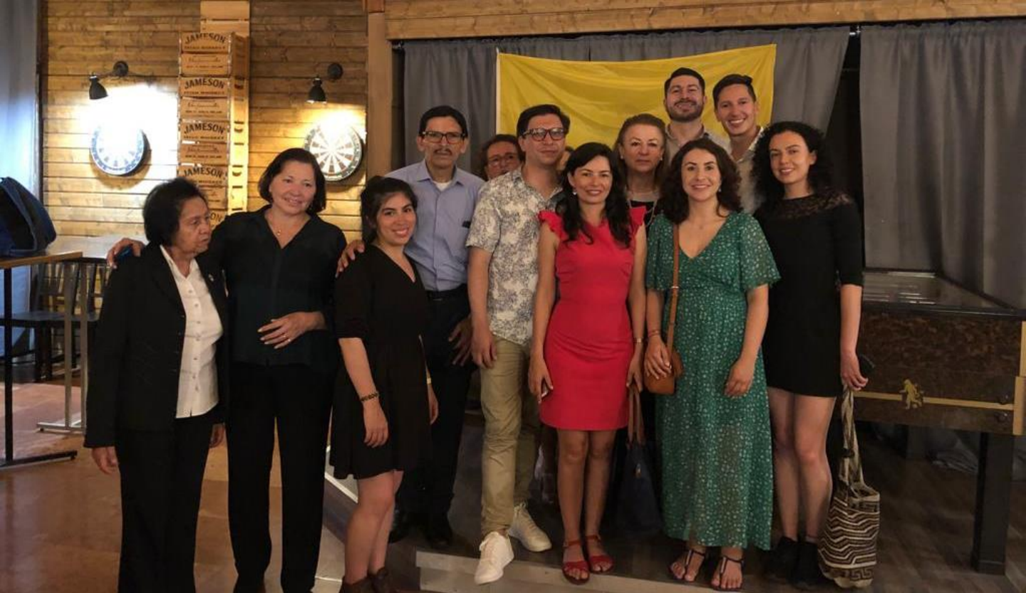
La delegación de la Embajada de Colombia junto con profesores de distintas universidades que asistieron al FIEALC