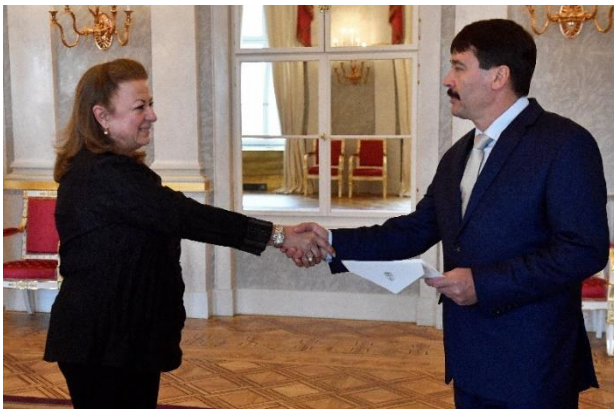
La Embajadora saluda al Presidente Janos Áder