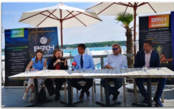
Inauguración del Festival de Verano de Budapest en 'Lupa Beach'.