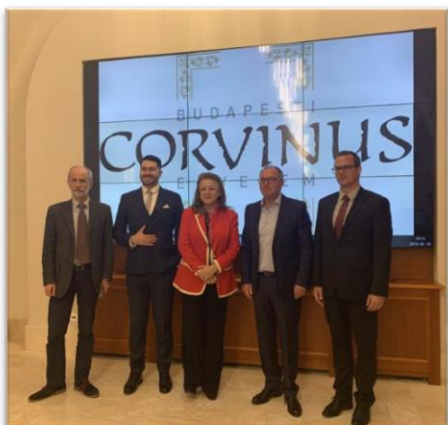
Conferencia de rectores en la Universidad CORVINUS en Budapest