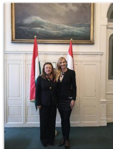
Encuentro con la Secretaria de Estado para el deporte, Tunde Szabó