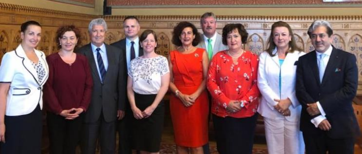
Embajadores de Perú, Chile, México y Colombia, con el Grupo de Amistad Hungría-América Latina