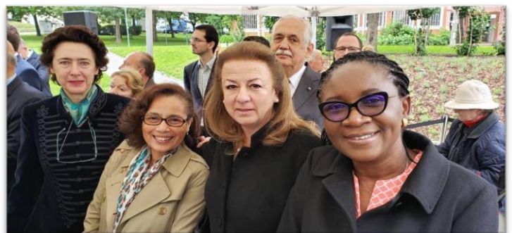
Embajadoras de Nigeria, España, Brasil y Colombia en inauguración de parque dedicado al Líbano.